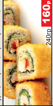
Хагакура (Соус «цезарь», салат «кайбер», курица жареная, томат) 240гр 160р

При заказе трех и более роллов стоимость за любой всего 111 рублей