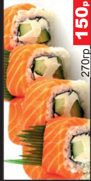
Филаделфия (Сливочный сыр, авокадо, лосось) 270гр 150р