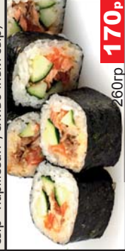
Сяке спайс (Острый соус, лосось жареный, огурец) 260гр 170р