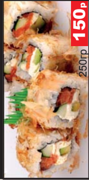
Бонито (Сливочный сыр, лосось, огурец, стружка тунца) 250гр 150р