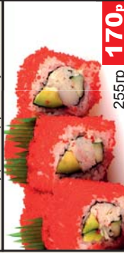
Калифорния (Майонез, авокадо, краб, огурец, икра летучей рыбы) 255гр 170р