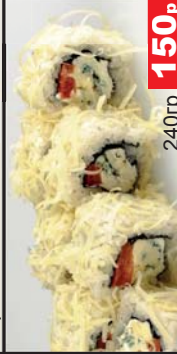
3 сыра (Сыр «данабл», томат, сыр «пармезан», сливочный сыр) 240гр 150р