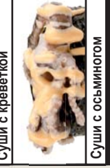
Суши с осьминогом 50р