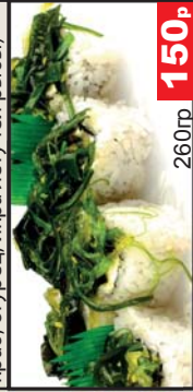
Чука (Сливочный сыр, лосось, водоросли «чука») 260гр 150р