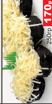
Цезарь (Соус «цезарь», салат, томат, курица жареная, сыр «пармезан») 250гр 170р