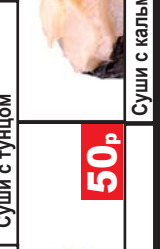
Суши с кальмаром 50р