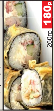
Фудзи (Сливочный сыр, бекон с/к, курица х/к, огурец) 260гр 180р