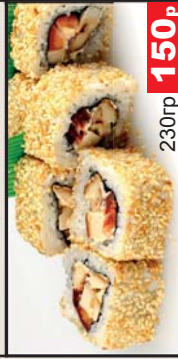
Тори (Майонез, курица х/к, томат, кунжут) 230гр 150р